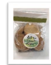
森育ちのしょうがクッキー 森育ちのしょうがパウダー・国産小麦使用 2021 年 6 月販売開始

WE ショップみなみでは、フェアトレード (公平・公正な貿易) で取引される食品などを仕入れ、販売することで、途上国の生産者を応援する活動をしています。