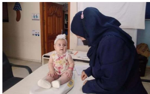
コミュニティセンターを使っての健診を再開。健診や講習に足を運んでくれた家庭の中で、子どもの栄養状態が悪く、特に貧困で家屋に被害があった世帯に、食料や衛生用品を配布します。