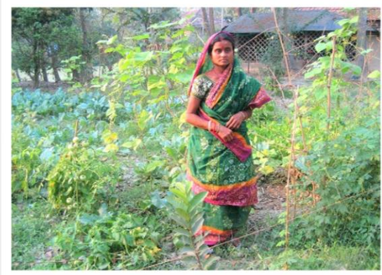
インド 農村女性たちの家庭菜園づくりなど

■民際支援金総額 807,471 円 海外 546,571 円 国内 260,900 円 ■フェアトレード等 250,467 円