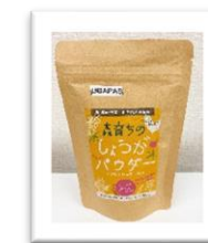
森育ちのしょうがパウダー フィリピン山岳地帯の先住民族の手作り