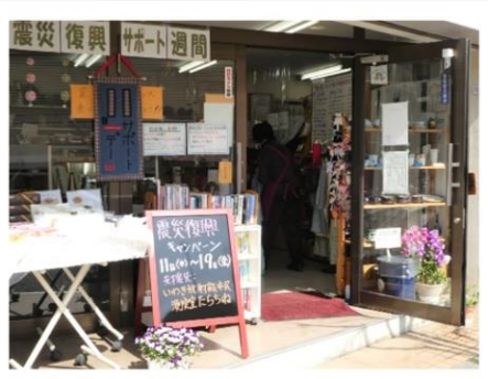
←震災復興サポート週間