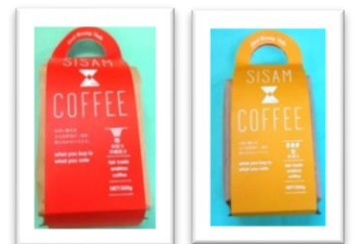
シサムコーヒー フィリピン山岳地帯の先住民族を支援