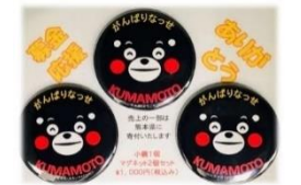
熊本豪雨災害復興支援 くまモン応援グッズ販売