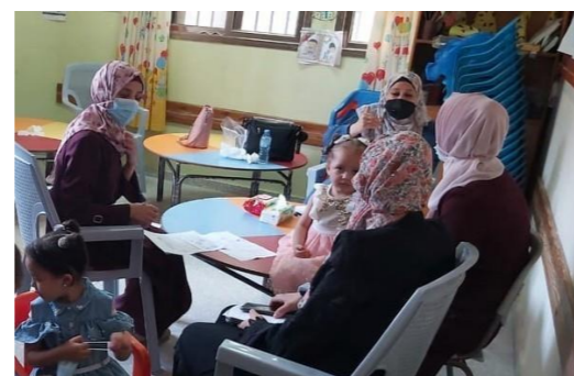
くる病の講習に参加してくれたお母さんと子どもたち。講習はお母さんたちのコミュニケーションの場ともなっています。