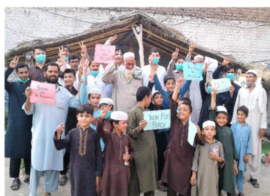
パキスタン 青少年の地域平和活動とアフガニスタンとの連携