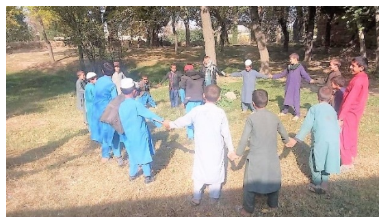
子どもたちに笑顔が!