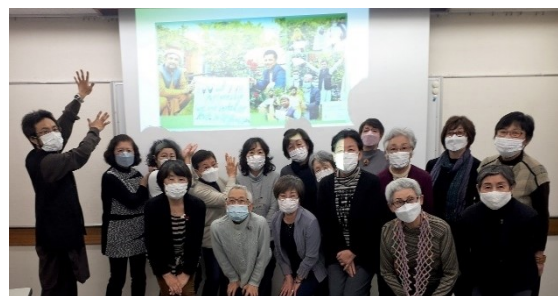
WE講座でユナイット!