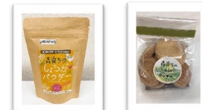
森育ちのしょうがパウダー フィリピン山岳地帯の先住民族の手作り