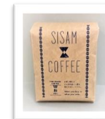
シサムコーヒー フィリピン山岳地帯の先住民族を支援